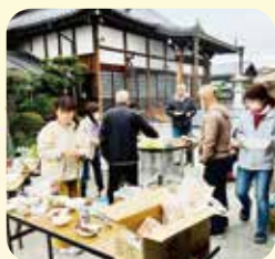
2022年報恩講前日祭 バーベキュー