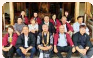
光照寺新生プロジェクトチーム