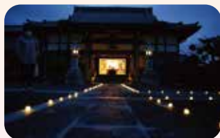
夏の送り火「ライトアップ」